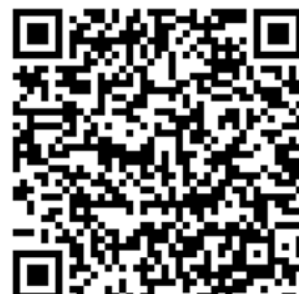
DVD 視聴 QR コード