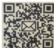
←運営委員会QRコード